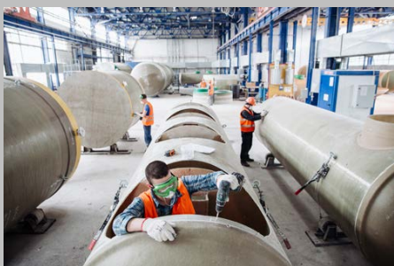
Производство г. Тольятти