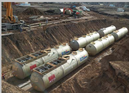
КОС ЭКО-Р-1000, ЖК "Цветы Башкирии", г. Уфа